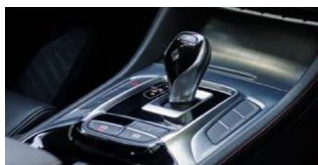
Možnost izbire 7-stopenjskega samodejnega menjalnika DCT na izvedenkah Comfort in Luxury