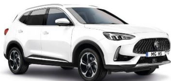
DOVER bela (enoslojna)