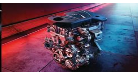
Zmogljiv 1.5 litrski, prisilno polnjivo-turbo motor, kateri zagotavlja 162 konjskih moči